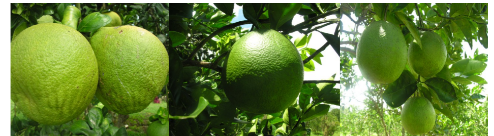
Fua o ituaiga moli & tipolo eseese